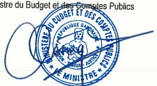
Sosthène OSSOUNGOU NDIBANGOYE